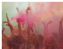
Festival der Farben am Strand