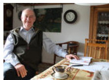
„Im Namen des Volkes“: Als Schöffe im Gerichtssaal