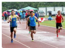
Jeder vierte Ostholsteiner ist im Sportverein